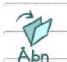
Figur 5: Load-mappen til at hente lyde du har indspillet.

Hvis du gerne vil hente og høre en lyd du allerede har indspillet trykker du på "Åbn-mappen", ved siden af grisen, se figur 5.