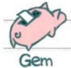
Figur 3: gemme-grisen.

Hvis du vil gemme din lyd trykker du på "gemme-grisen", se figur 3.