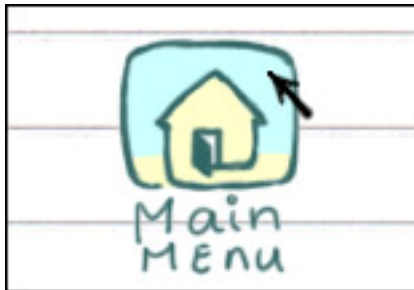
Figur 6: Tilbage knappen til at komme tilbage til start menuen.

Når du har indspillet og gemt alle de lyde du syntes du skal bruge til din film, trykker du på "main menu" ikonet, med det lille hus (figur 6) og vender tilbage til hoved menuen.