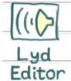
Figur 1: Lyd editor ikonet

I start menuen trykker du på "Lyd editor" ikonet, som er billedet af en lille højttaler, se figur 1.