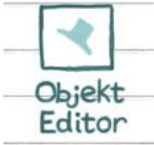
Figur Objekt editor ikonet

I hovedmenu'en trykker du på "objekt editor" ikonet, som er billedet af en hat, se figuren.