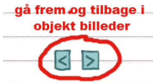
Figur 2: bladre i billeder

Ved at trykke på en af pilene går man til det næste billede i stakken. Det billede kan man så ændre/farvelægge lige som de andre enkelt billede objekter.